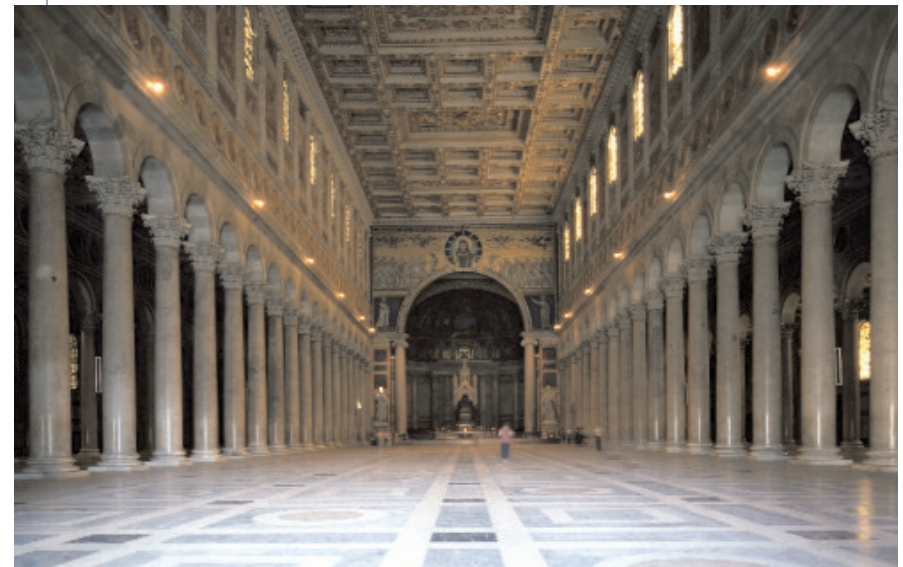
Innere der Basilika