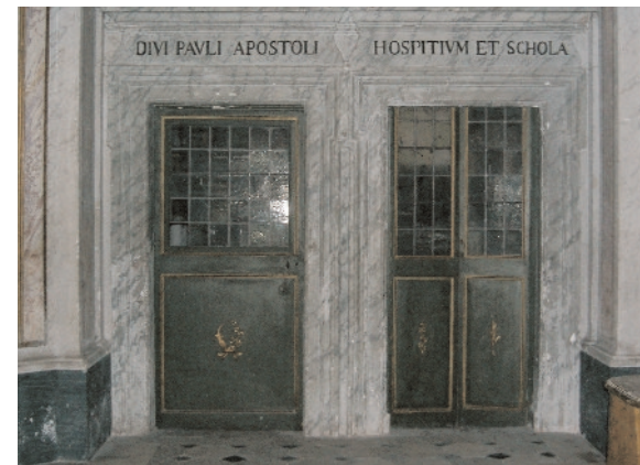
Kirche San Paolo alla Regola , nach einer alten Überlieferung an der Stelle erbaut, wo sich das Haus des hl. Paulus befand