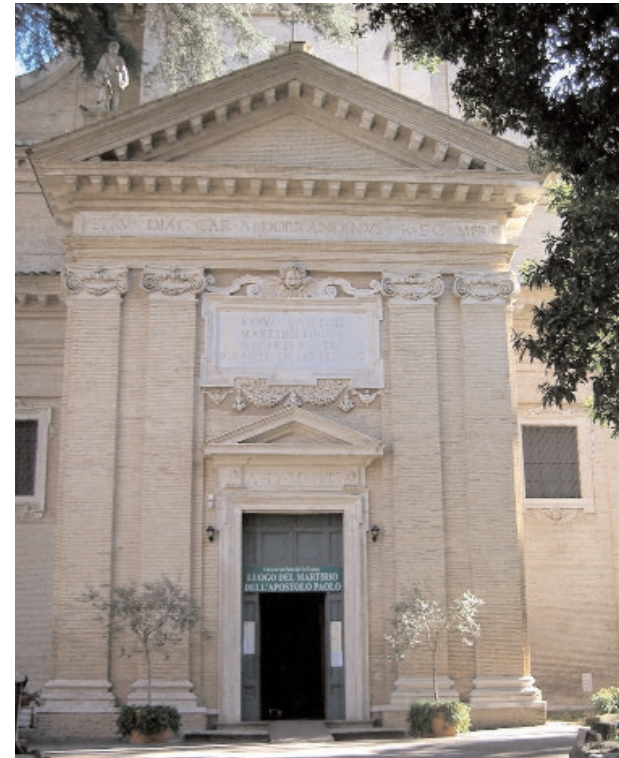
Kirche des hl. Paulus ad tres fontes , erbaut an dem Ort des Martyriums des Apostels. Das Innere der Basilika

Gott segnete diese fruchtbare Tätigkeit der ersten Zeiten der römischen Kirche. Sie fand Anhänger durch ein persönliches Apostolat, und schon während seiner Gefangenschaft schickte Paulus an die Kirchen die Grüße der Christen, die im Haus des Cäsar wohnten (Phil 4, 22). Diese Christen vom Haus des Caesar waren Beamte der kaiserlichen Verwaltung. Sicher freute es die Christen von Philippi, zu erfahren, daß das Evangelium auch in diese Bereiche eingedrungen war, von denen aus man so viel tun konnte, um die Gesellschaft zu ändern.