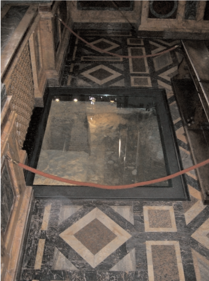
Unter dem Altar der Confessio der Basilika wurde ein Marmorsarkophag gefunden, von dem man denkt, er sei derjenige, in den der Leichnam des hl. Paulus gelegt wurde.