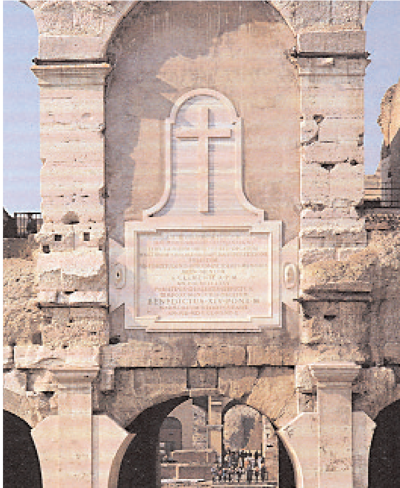
Gedenkstein der Weihe des Kolosseums als einer heiligen Stätte