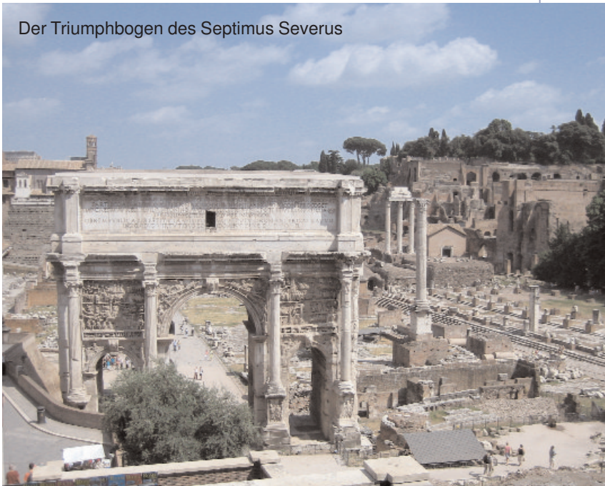
Der Triumphbogen des Septimus Severus

Feldzüge eingemeißelt, um diese ruhmreichen Augenblicke und die Kaiser als ihre Protagonisten für die kommenden Jahrhunderte festzuhalten. Diese zogen zudem unter dem Applaus und dem Jubel des Volkes mit ihren Truppen durch die Via Sacra.