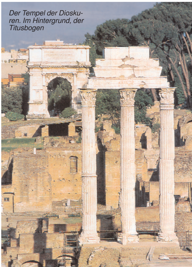
Der Tempel der Dioskuren. Im Hintergrund, der Titusbogen

tem Bürgersinn und Verrat an den vaterländischen Sitten ausgelegt wurde. Das war einer der Anspielungen in den scharfen Vorwürfen, die Celsus den Christen machte: Sie weigern sich, die öffentlichen Zeremonien zu beobachten und denen, die sie leiten, Ehre zu erweisen? Dann sollen sie auch darauf verzichten zu heiraten und Kinder zu zeugen und alle Funktionen aus-