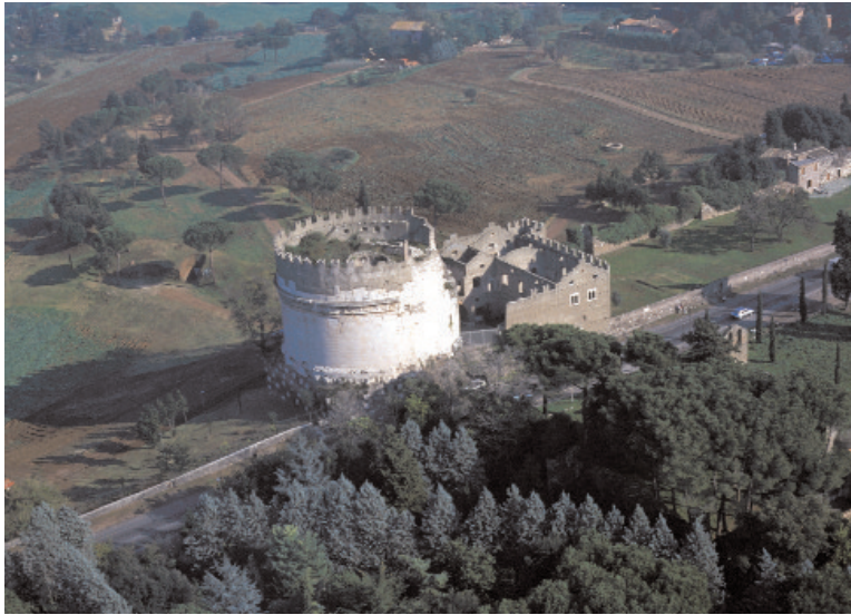
Das Mausoleum von Cäcilia Metella an der Via Appia