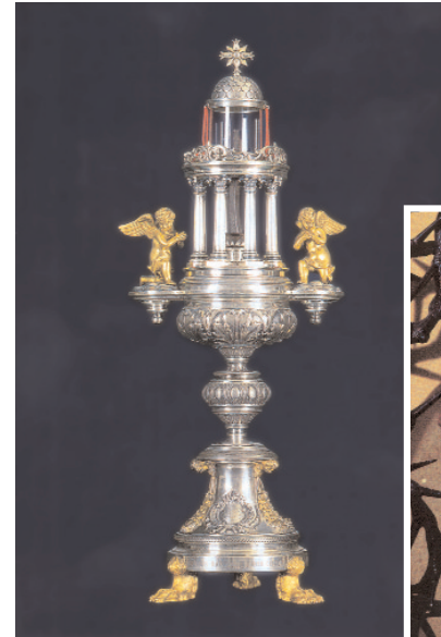
o Das Reliquiar mit dem Nagel. Darunter die Dornen der Dornenkrone