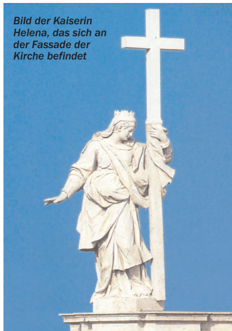
Bild der Kaiserin Helena, das sich an der Fassade der Kirche befindet

Die ersten kirchlichen Geschichtsforscher kommentierten nicht ohne Ironie das Endergebnis dieser Anstrengungen der Heiden. Arme Menschen! - redete sie Eusebius von Cäsarea an. - Sie glauben, es sei möglich, dem Menschengeschlecht den Glanz der Sonne vorzuenthalten, der sich über die Welt ergossen hatte. Sie verstehen noch nicht, daß man Den nicht unter der Erde versteckt halten kann, Der bereits den Sieg über den Tod errungen hat 1 . Und in der Tat erlaubten diese beiden heidnischen Tempel im 4. Jahrhundert, als die Kirche schließlich in Freiheit leben konnte, mit absoluter Gewißheit den Ort der heiligen Stätten zu lokalisieren. Es genügte, sie niederzureißen und darunter zu graben, um das Heilige Grab und den Gipfel des Golgota zu finden.