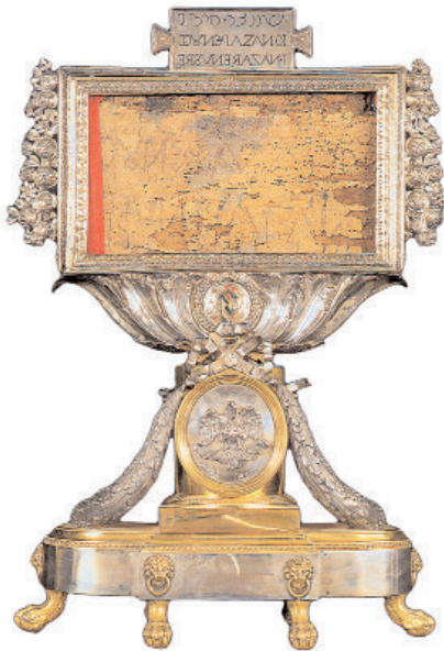
Reliquiar mit dem Titulus Crucis, geschrieben auf hebräisch, griechisch und lateinisch, aber in allen drei Fällen von links nach rechts

3. Hl. Ambrosius, De obitu Theodosii, Nr. 43-44.