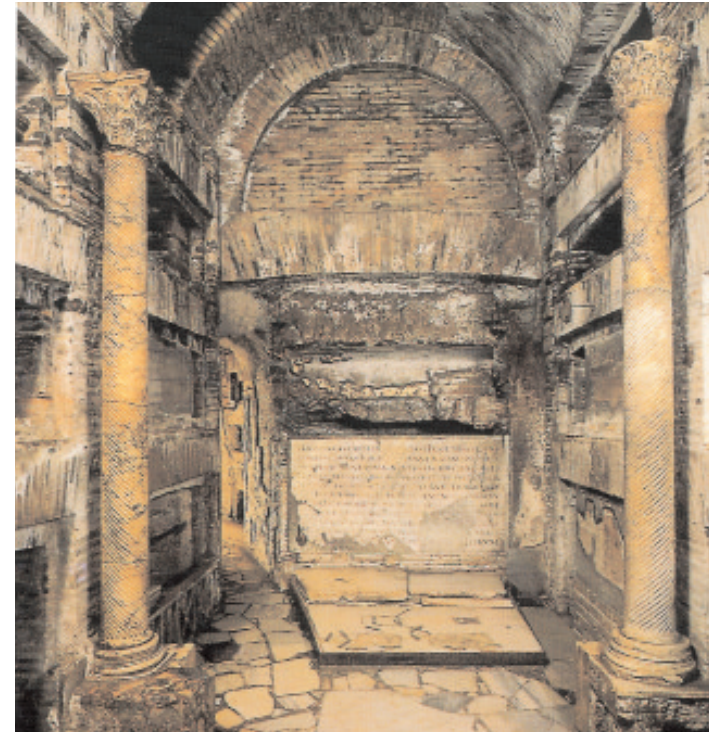
In der Krypta der Päpste wurden sechs Päpste des dritten Jahrhunderts begraben, dazu einige Priester und Diakone, die zusammen mit Papst Sixtus II. das Martyrium erlitten. Im Hintergrund befindet sich eine Steinplatte, die der hl. Damasus aufstellte. Dort steht:

Auch nach dem konstantinischen Frieden blieben die Katakomben Begräbnisstätten. Sie wurden auch zu Wallfahrtsorten. Nach der Plünderung Roms durch Alarich im 5. Jahrhundert wurden die Gebiete außerhalb der Stadt immer unsicherer und daher weniger besucht. Im 9. Jahrhundert faßt man den Entschluß, die Gebeine der Heiligen in die Kirchen innerhalb der Stadt zu verlegen; und im Mittelalter geraten die Katakomben immer mehr in Vergessenheit; niemand geht dorthin und bald kennt man die Lage der einzelnen nicht mehr.