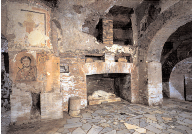
Die Krypta der hl. Cäcilia