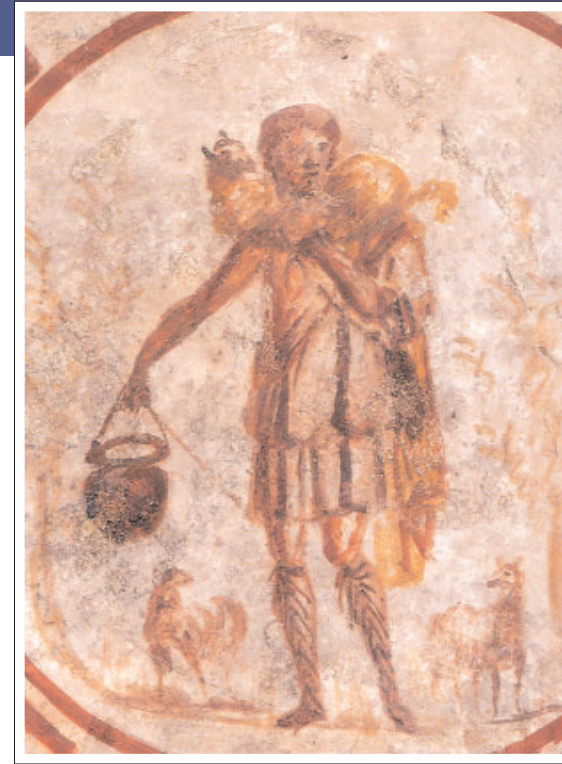
Bild des guten Hirten, das ein Gewölbe der Kalixtus-Katakombe schmückt. Es wurde von Christen des dritten Jahrhunderts gemalt.

mer gegenwärtig, denn es genügte die Anklage eines Feindes, damit ein Prozeß angestrengt wurde. Wer sich bekehrte, war sich vollkommen bewußt, daß das Christentum eine radikale Option war, die den ehrlichen Wunsch, heilig zu werden, und das Bekenntnis des Glaubens - wenn nötig - bis zur Hingabe des Lebens einschloß. Das Martyrium wurde unter den Christen als ein Privileg, als eine besondere Gnade Gottes betrach-