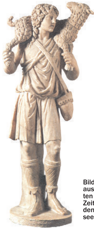
Bild des Guten Hirten aus der Mitte des vierten Jahrhunderts. Zur Zeit befindet es sich in den Vatikanischen Museen

nimm sie auf deine Schultern; daß sich jene liebenswerte Gestalt wiederfinde, die wir in den Katakomben betrachten können. Wenn der Hirt das verlorene Schaf wiederfindet, nimmt er es froh auf seine Schultern und wenn er nach Hause kommt, ruft er seine Freunde und Nachbarn zusammen und sagt zu ihnen: Freut euch mit mir; ich habe mein Schaf wiedergefunden, das verloren war (Lk 15, 5-6) 8 .