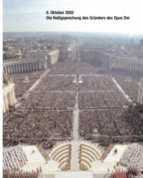
6. Oktober 2002 Die Heiligsprechung des Gründers des Opus Dei

Die sterblichen Überreste des heiligen Josefmaria ruhen in einem Sarkophag unter dem Altar in der Kirche Unsere Liebe Frau vom Frieden. Millionen von Menschen aus der ganzen Welt wenden sich an seine Fürsprache, um Gott, unseren Herrn, um Gnaden jeglicher Art zu bitten. Viele Menschen kommen zur Prälaturkirche, um weiter zu bitten oder sich für die durch seine Fürsprache empfangenen Gnaden zu bedanken.