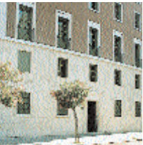
Viale Bruno Buozzi 75