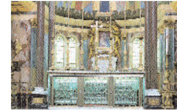
Altar, unter dem der Leichnam des heiligen Josefmaria ruht