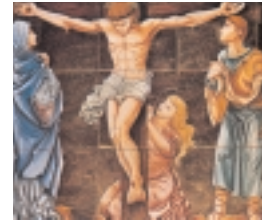
Der Kreuzweg, 12. Station: Christus am Kreuz. Keramik

Krypta befinden sich die Sakramentskapelle und die Beichtstühle. Der heilige Josefmaria hat immer mit Nachdruck den häufigen Empfang der Sakramente der Buße und der Eucharistie empfohlen, die uns von Gott als Quellen der Freude und des Friedens geschenkt wurden.