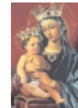
Unsere liebe Frau vom Frieden. Altarbild

“Unsere Liebe Frau ist die Königin des Friedens. Mit diesem Namen preist die Kirche sie. Ist deine Seele aufgewühlt, droht Kummer in Familie oder Beruf, kündigt sich Unheil an in der Gesellschaft oder unter den Völkern, dann bete zu ihr: «Regina pacis, ora pro nobis!» - Königin des Friedens, bitte für uns! Hast du das - zumindest in Zeiten innerer Unruhe - schon versucht?... Du wirst staunend ihre sofortige Hilfe erfahren.”